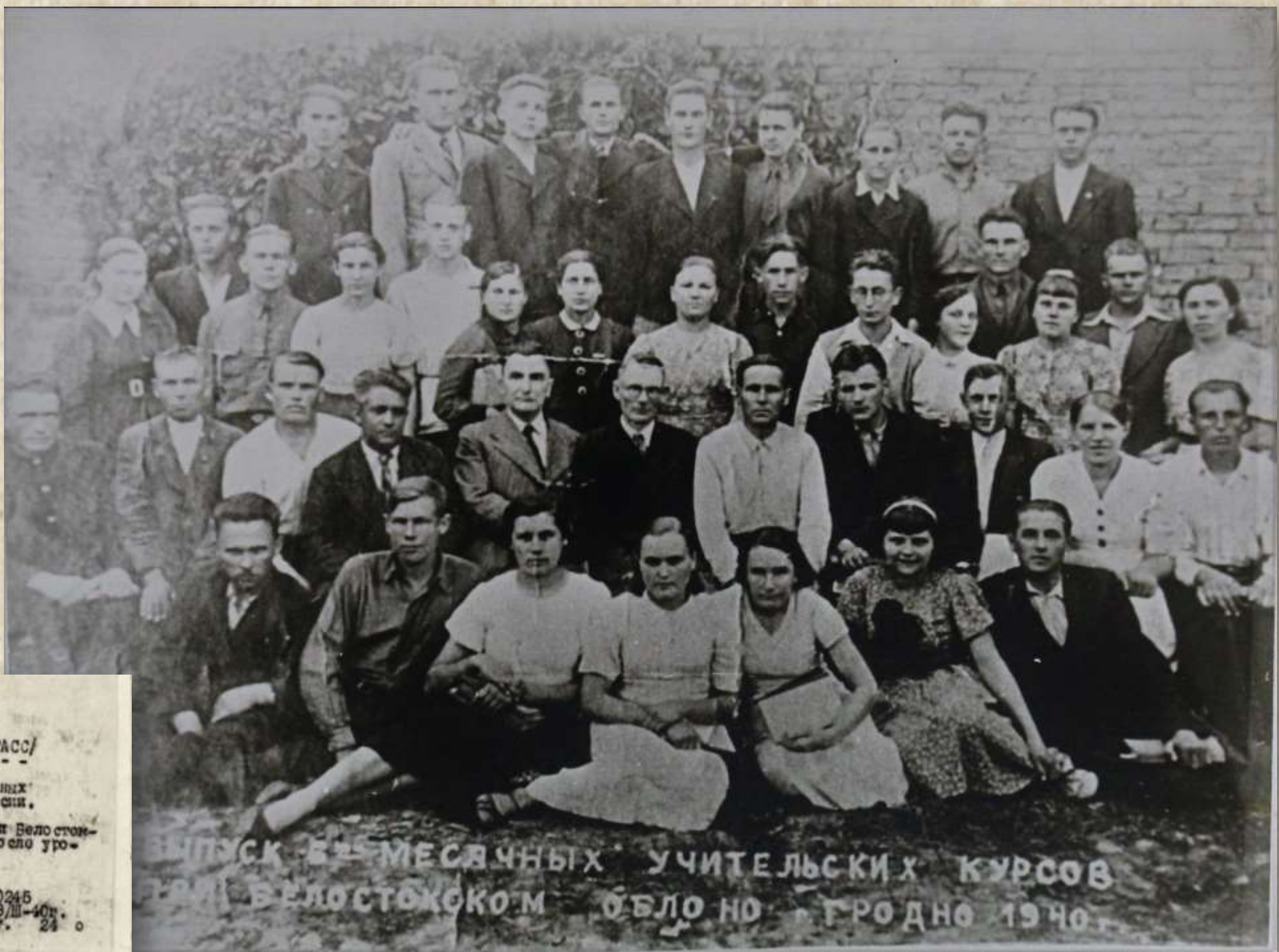
ВЫПУСК 6-МЕСЯЧНЫХ УЧИТЕЛЬСКИХ КУРСОВ В БЕЛОСТОКЕ ОБЛО ГРОДНО 1940