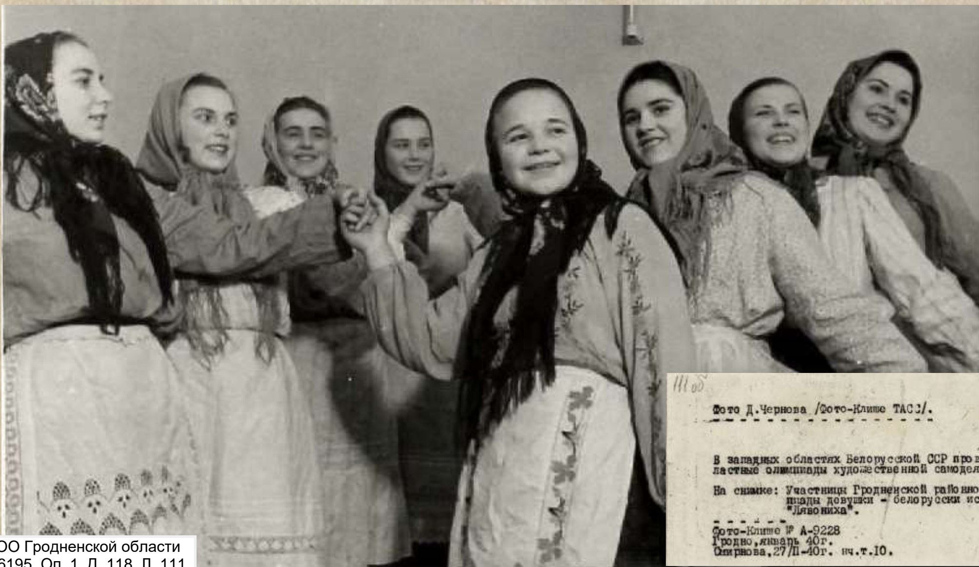
ГАОО Гродненской области Ф. 6195. Оп. 1. Д. 118. Л. 111