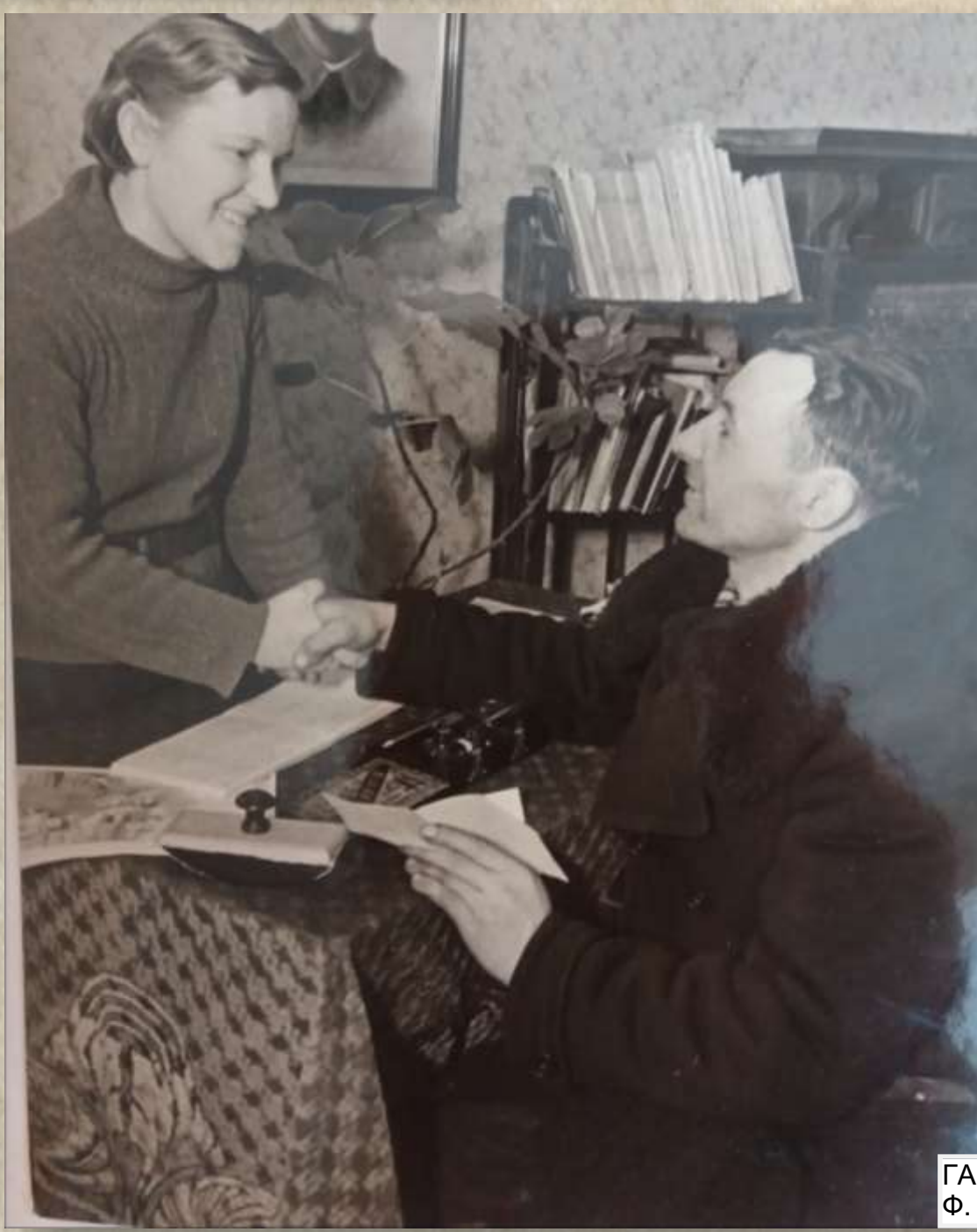
ГАОО Гродненской области Ф. 6195. Оп. 1. Д. 118. Л. 98