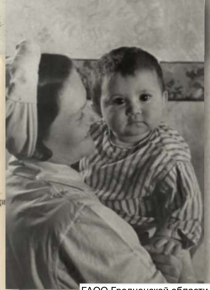
ГАОО Гродненской области Ф. 6195. Оп. 1. Д. 118. Л. 89

ГАОО Гродненской области Ф. 6195. Оп. 1. Д. 352. Л. 19