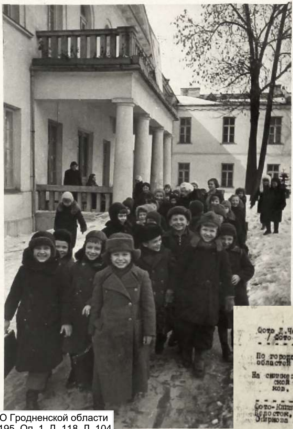
ГАОО Гродненской области Ф. 6195. Оп. 1. Д. 118. Л. 104