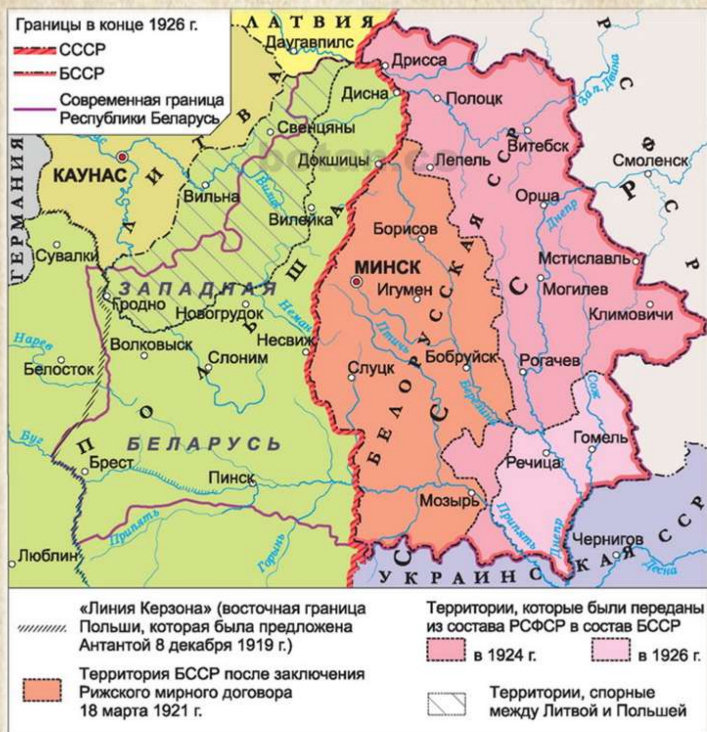
Территория Беларуси после заключения Рижского мирного договора. Укрупнение БССР в 1924 и 1926 гг.

Означенные уполномоченные, сехавшись в г. Риге по взаимном предъявлении своих полномочий, признанных достаточными и составленными в надлежащей форме, согласились в нижеследующем: