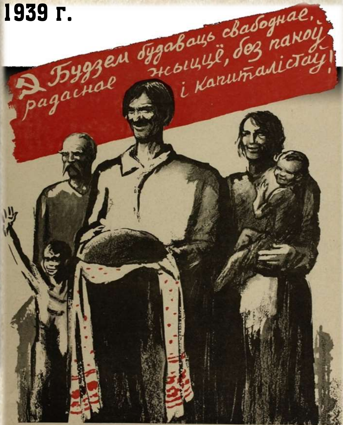
ОПОРА И НАДЕЖДА (В Западной Белоруссии)